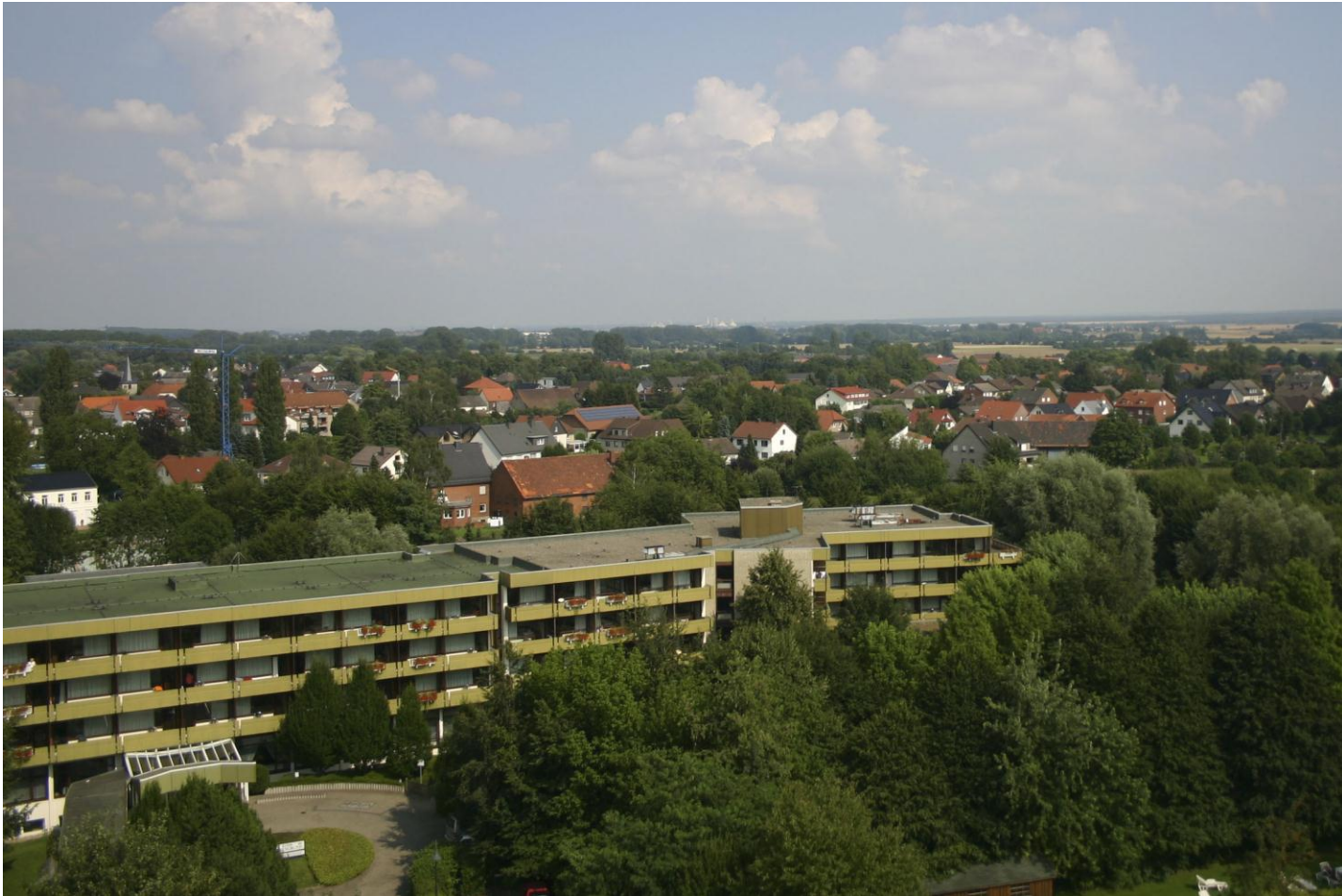
Wiesengrund und Solequelle